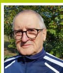
RIBALTA Raphaël MOSELLE