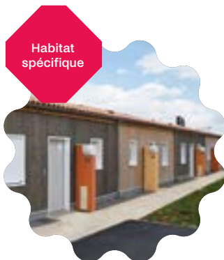
Coulonges- sur-l'Autize (79) Les Jardins de l'Autize

Les 30 maisons des «Jardins de l'Autize» ont posé la première pierre d'un futur quartier intergénérationnel et inclusif. L'ensemble construit par Immobilière Atlantic Aménagement sera ainsi prochainement complété par un nouvel EHPAD, porté par 3F Résidences, ainsi qu'une résidence jeune. Avec 27 logements labellisés HSS® Plus et 3 Cap'Autonomie®, ce programme garantit autonomie et maintien à domicile aux seniors et personnes en situation de handicap. Un programme également vertueux d'un point de vue environnemental par ses performances énergétiques et bas carbone (labellisation E+C-).