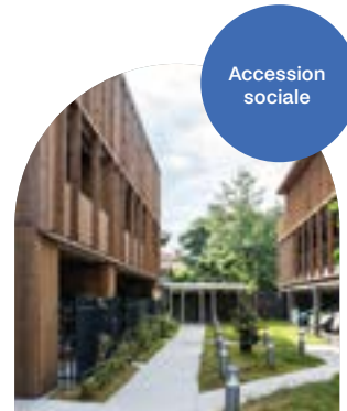
Lacanau (33) Le Garage

de logements labellisés HSS® au sein de la Communauté de Communes