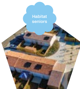
Melle (79) Les Allées de Jades

de logements spécifiques dans un futur quartier intergénérationnel