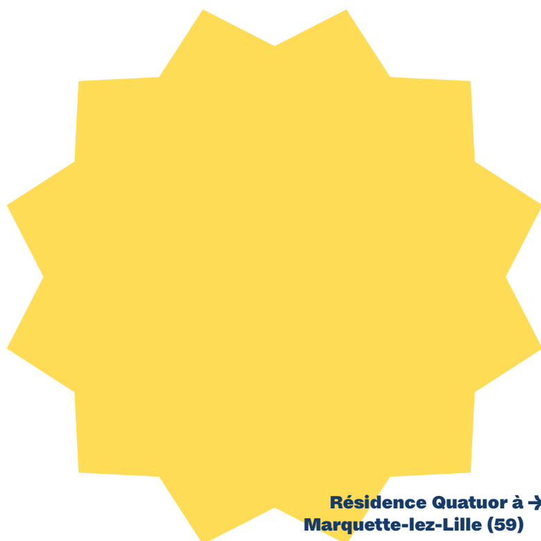
Résidence Quatuor à → Marquette-lez-Lille (59)