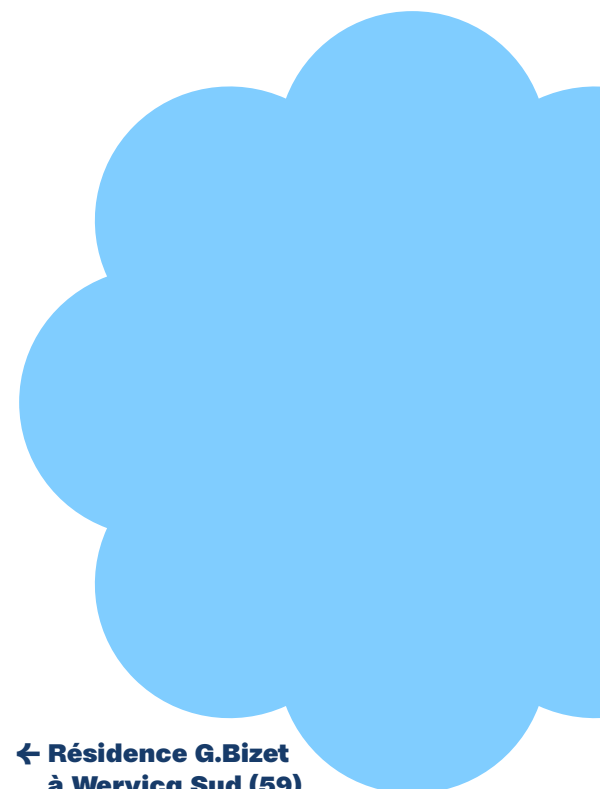
← Résidence G.Bizet à Wervicq Sud (59)