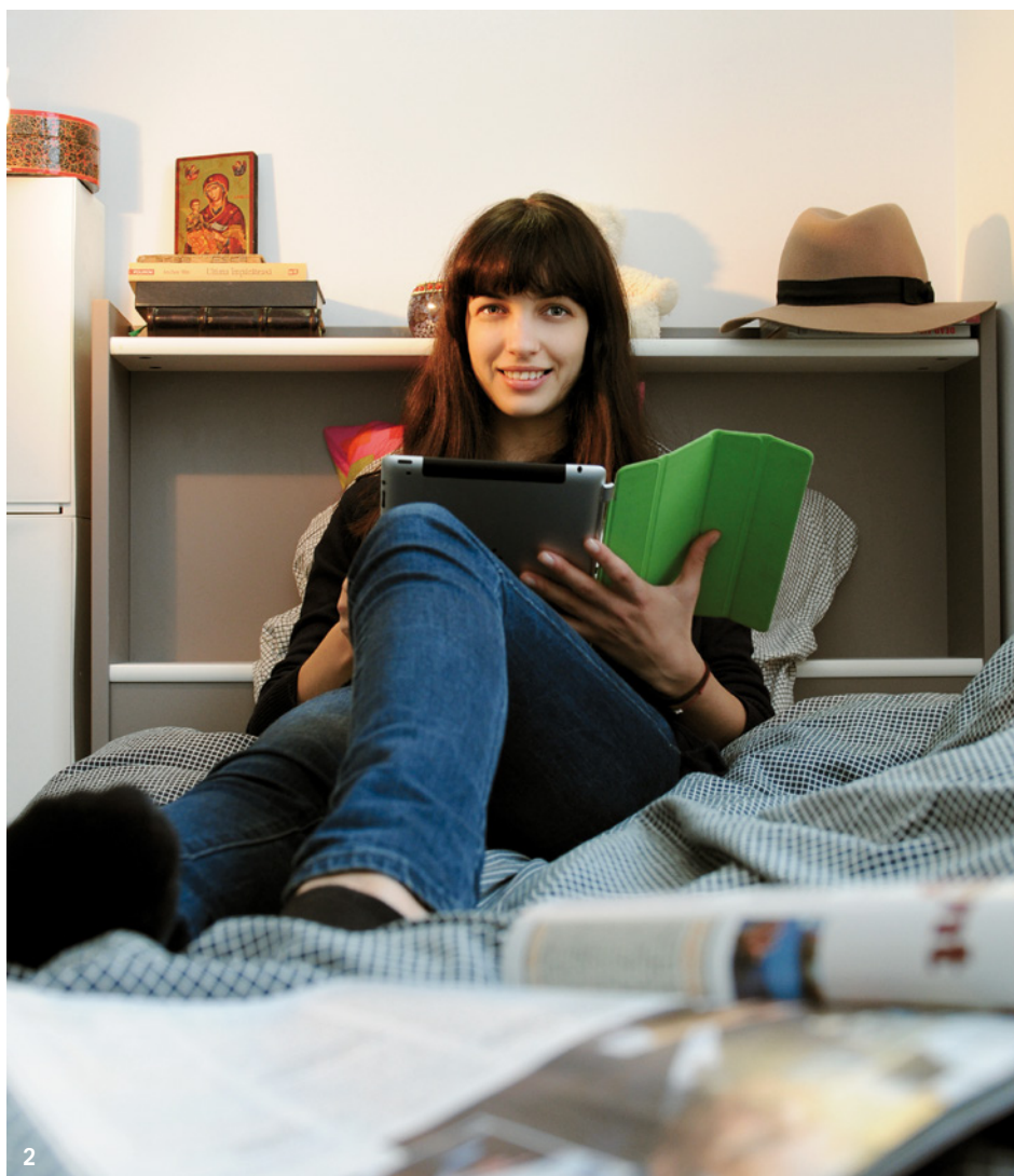
1 • Puiseux-le-Hauberger (60) Résidence sociale, 82 Grande Rue © 3F/Sylvie Duverneuil 2 • Gennevilliers (92) Résidence pour étudiants, 13-15 rue Basly © 3F/Sylvie Duverneuil