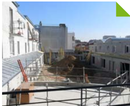
Résidence Sainte-Marie - vue sur la cour

Les relogements se poursuivent et s'achèveront avec la livraison en octobre prochain des logements neufs, situés à l'angle des rues Jaffeux et Sainte-Marie.