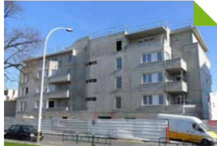
Résidence Sainte-Marie - vue depuis la rue