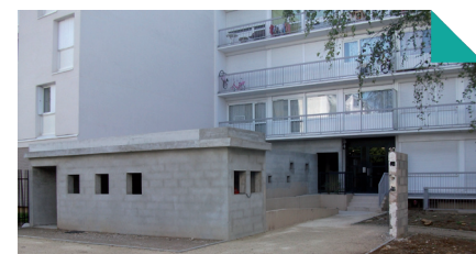
Création d'un futur local ordures ménagères/tri

➤ Les travaux de réhabilitation des réseaux d'assainissement des eaux usées et pluviales réalisés par la Communauté d'agglomération Evry Centre Essonne sont terminés.