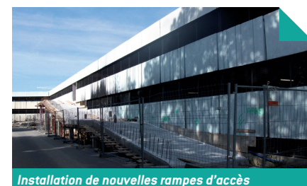
Installation de nouvelles rampes d'accès