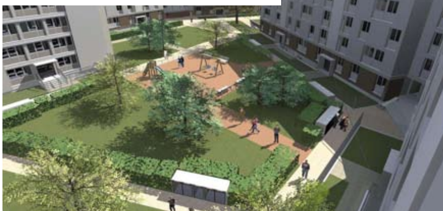
Le square Diderot demain

Les travaux d'aménagement du square ont débuté. Cheminements, espaces verts, tout va être revu et amélioré. Les clôtures de résidentialisation seront posées à partir du mois de mai.