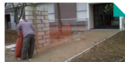
Installation des trinettes

Le futur local tri du V1 est également en travaux jusqu'au mois de juin. Vous pourrez bientôt y déposer vos déchets au moyen de trappes passe-paquets.