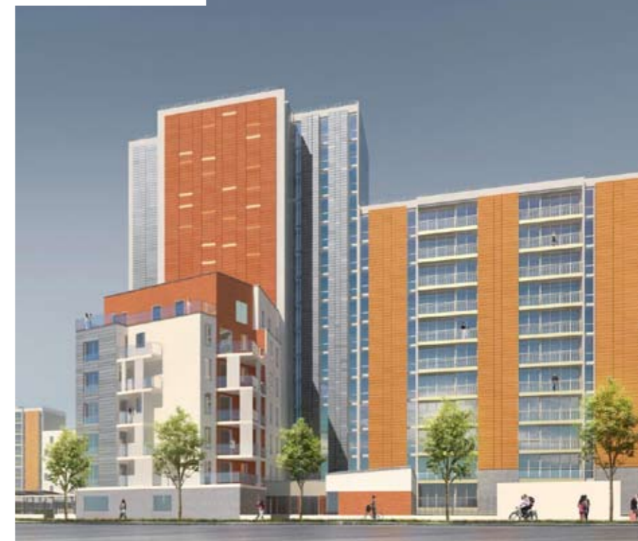
Une nouvelle construction en pignon d'un immeuble conservé

Le projet d'amélioration et de ré-urbanisation de la Cité-Rouge prévoit la reconstruction de 39 logements.