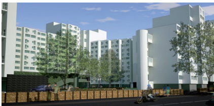
Requalification Îlot 4 - Vue depuis la rue Beaudoin

L'ampleur des travaux nécessite une organisation et un planning précis.