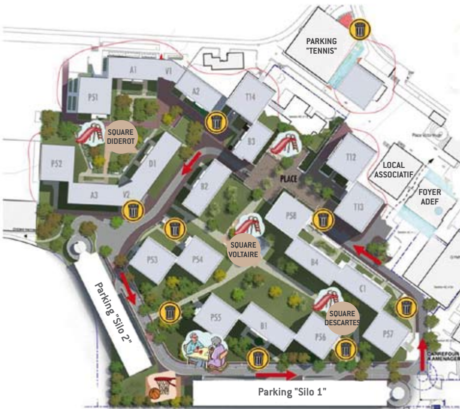
Le quartier demain