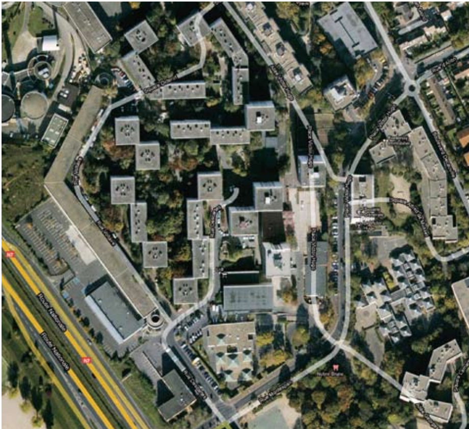
Le quartier aujourd'hui