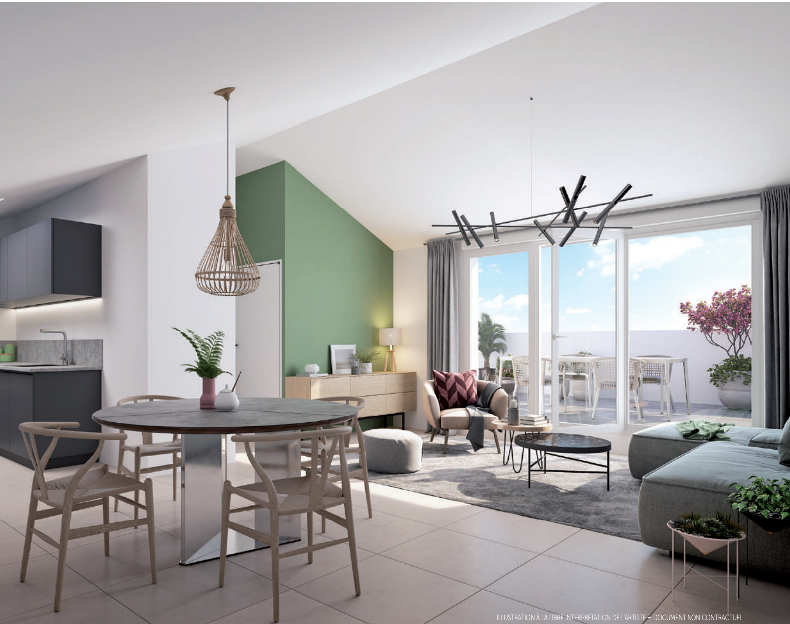
ILLUSTRATION À LA LIBRE INTERPRÉTATION DE L'ARTISTE - DOCUMENT NON CONTRACTUEL