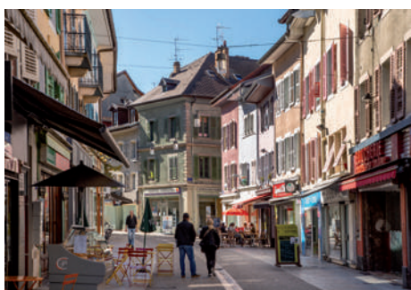
Grande Rue de Thonon-les-Bains

À 8 km* de Thonon-les-Bains, Lyaud est une charmante commune aux airs de petit bourg. Du massif des Hermones, en passant par les forêts, les berges de la Dranse et les vouas du Lyaud, les paysages sont aussi variés qu'enchantés. Les nombreux sentiers invitent à partir à la découverte des rues du village avec ses bassins et ses fontaines ou à gravir les collines du Cez qui contemplant le Jura et le Lac Léman, l'un des plus beaux lacs d'Europe.