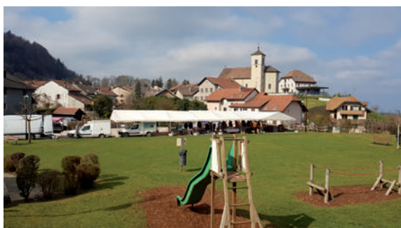
Jour de marché à Lyaud