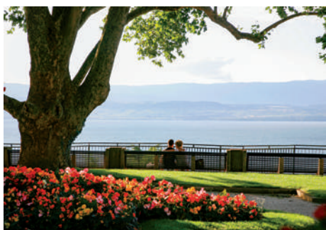
Parc du Belvédère de Thonon-les-Bains