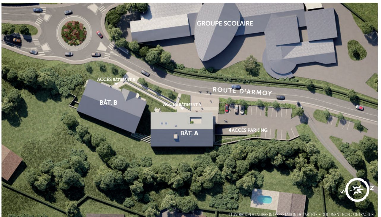
ILLUSTRATION À LA LIBRE INTERPRÉTATION DE L'ARTISTE - DOCUMENT NON CONTRACTUEL