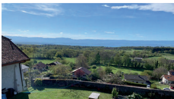
Belvédère du centre du village