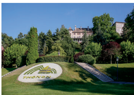
Office du tourisme de Thonon-les-Bains